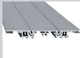
Steckrahmen Wechseltechnik Bautiefe: 170 mm Ausführung: 2-seitig

Backloading technology Installation depth: 100 mm Design: 1-sided