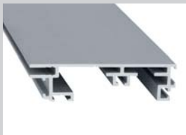
Steckrahmen Wechseltechnik Bautiefe: 85 mm Ausführung: 1-seitig

Backloading technology Installation depth: 85 mm Design: 1-sided