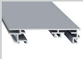
Steckrahmen Wechseltechnik Bautiefe: 100 mm Ausführung: 1-seitig

Backloading technology Installation depth: 85 mm Design: 1-sided