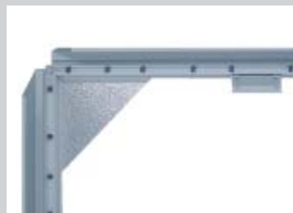
Geöffneter Grafikrahmen „45“ mit Feineinstellungsprofil

Open picture frame "45" with fine adjustment profile