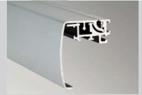
Klapprahmen Wechseltechnik Bautiefe: 45 mm Klappleiste: 65 mm Ausführung: 1-seitig

Hinged alternate frame technology Installation depth: 45 mm Cover strip: 45 mm Design: 1-sided