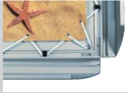
Geöffneter Grafikrahmen „45“ Spanntechnik mit Klapprahmen Wechseltechnik

Open tenter picture frame "45" with hinged alternate frame technology