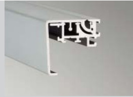
Klapprahmen Wechseltechnik Bautiefe: 45 mm Klappleiste: 45 mm Ausführung: 1-seitig

Open tenter picture frame "45" with hinged alternate frame technology