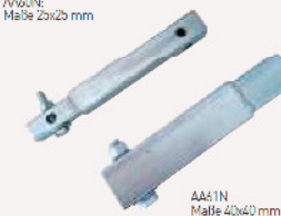
AA61N Maße 40x40 mm

N.B.: Bitte überprüfen Sie die Kompatibilität des Zubehörs mit den entsprechenden Spiegeln.